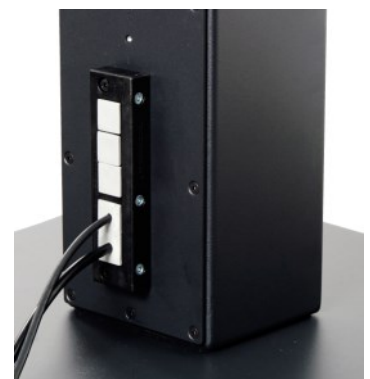
Kabel Zuführung oder durch die Bodenplatte