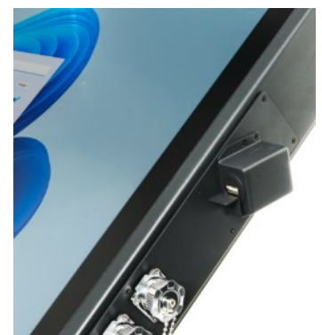
USB mit Auflage für PassKey USB IP67 mit verschlossen