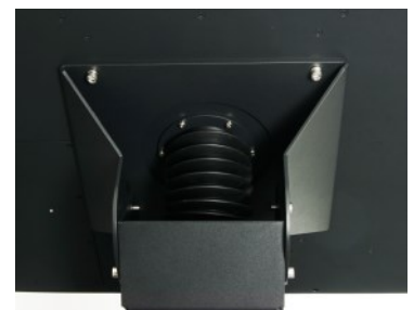
Kabelführung flexibel und dicht